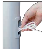
Nach dem Hiszen Seil in Schlaufen legen und als Bund in das Bediengehäuse stecken.