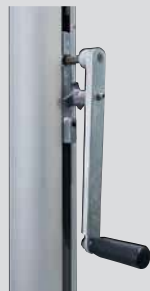
Kurbelhissvorrichtung FlagLift® Handkurbel