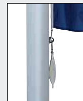
Untersten Karabiner – zusammen mit Fahnenstraffergewicht in Öse des untersten Fahnentuchhalters einhaken.