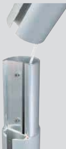
Steckstoß ZI75 2-teilig

5 Jahre Garantie auf Standicherheit der Mastrohre