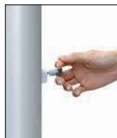
Entsperrstift ziehen, Riegel nach unten schieben: ENTSICHERN

patentierter Kurbel-Hissystem FlagLift® besteht aus dem Kompaktantrieb mit VA-Antriebsrad, dem VA-Hisseil und dem Langschlitten mit Federvorspannung. Alle Bauteile befinden sich in der Mastnut. Die Seilarretierung wird durch eine Federbremse bewirkt, die durch einfaches Anheben des Sicherungsriegels das Antriebsrad blockiert und den Steckerzugang für die Handkurbel verschließt. Die Entriegelung erfolgt mittels eines Spezial-Entsperrstiftes in einem Handgriff.