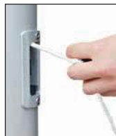
Hiszen der Fahne durch horizontales Ziehen, Einholen durch Loslassen.

klassische Innenseilführung mit dem im Mastrohr laufenden PES-Hisseil. Die Handhabung des Hissseiles erfolgt über das Bediengehäuse mit (SchnellFixierSystem) SFS mit sperrbarem Türchen. Hiszen und Abnehmen der Fahnen erfolgt durch Ziehen bzw. Nachlassen des Hisseiles. Bei Loslassen arretiert das Hisseil selbsttätig in der Spezial-Seilklemme im SFS-Gehäuse.