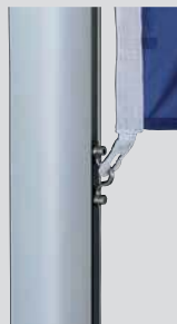
Zubehör: Fahnenstraffer, unverlierbar