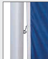
Mittleren Karabiner in die Ösen der Fahnentuchhalter einhaken.