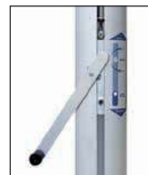
Kompaktantrieb, Handkurbel mit Entsperrstift