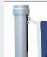
Obersten Fahnenkarabiner in Öse des Zugschlittens einhaken.

Es können alle gängigen, frei auswehenden Fahnen gehisst werden. Die maximal zulässigen Fahnengrößen sind unter den technischen Daten aufgeführt. Abgespannte Bannerfahnen sind grundsätzlich ab 7 Beaufort (50 – 61 km/h) Wind abzunehmen.